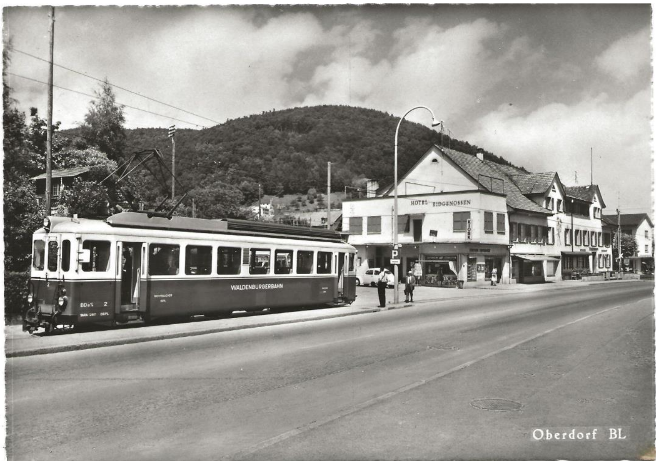
Foto: Landgasthof Eidgenossen, 1960er Jahre