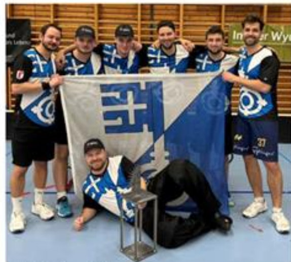
Sieg in Oberentfelden

Zu guter Letzt kam das, auf was wir uns schon das ganze Jahr über intensiv gefreut haben: Unser Skiweekend. Dieses Jahr ging es mit dem Car für einmal ins nahe Ausland nach Ischgl. Bei prächtigstem Wetter genossen wir die tollen Pisten und Après-Ski-Hütten. Am Sonntag wurde dann im Wellnessbad sich ausgiebig erholt und bei der Heimfahrt ein neuer Après-Ski-Hit kreiert.