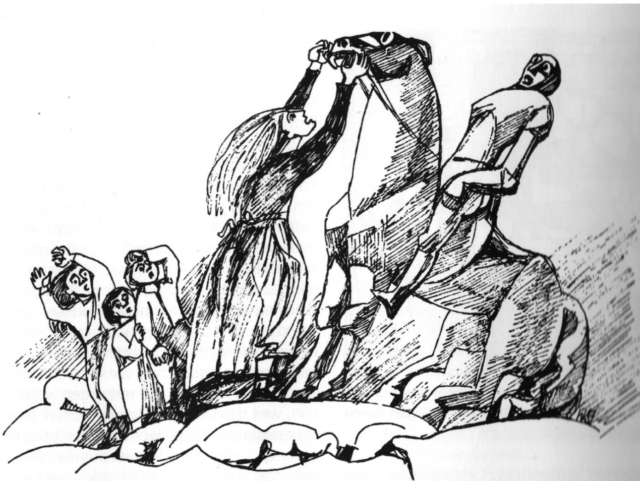
der steinerne Ritter