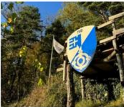
Rebhäuschen oberhalb von Oberdorf

Auch das Sommerprogramm in den Sommerferien wurde wieder ausgiebig zelebriert und man traf sich z.B. auf einen Schwumm im Wheel Pool auf der Benkenmatt oder einen gemütlichen Grillabend